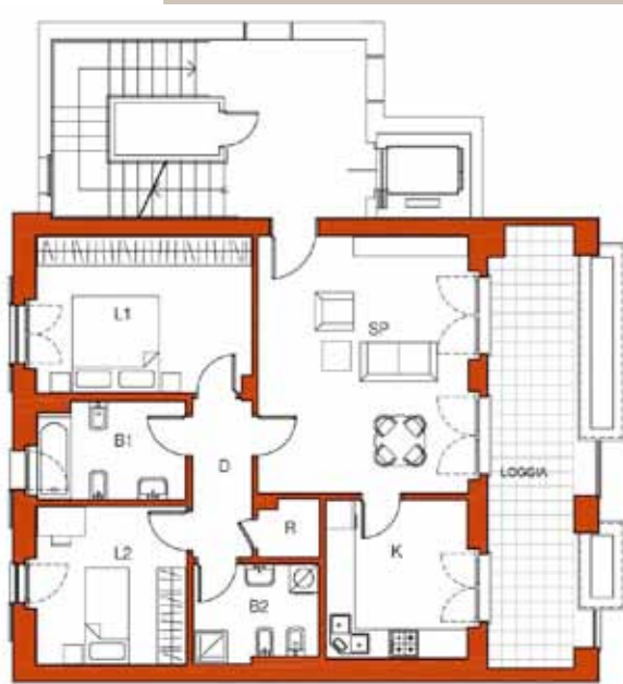
Esempio di trilocale tipo con doppi servizi