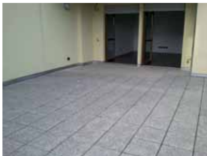
Giardino appartamento piano rialzato