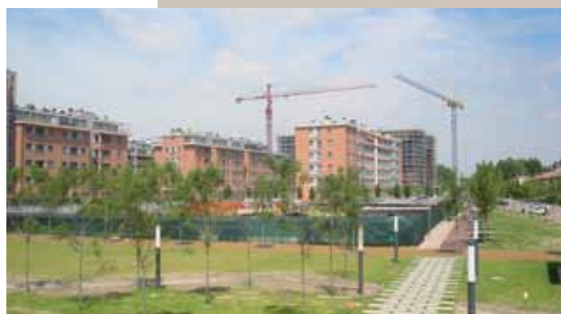
Area di cantiere del Lotto L