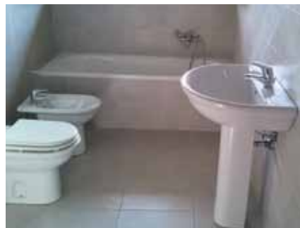
Bagno per appartamento piano terra