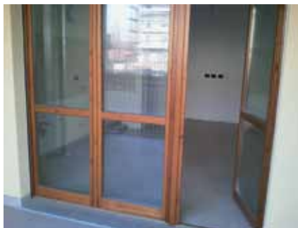
Serramenti in legno con doppi vetri