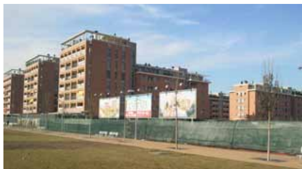
L'area su cui sorgerà l'edificio