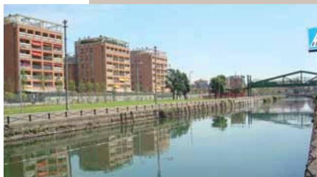
Vista dal Naviglio