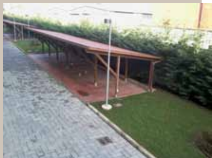
I posti auto coperti