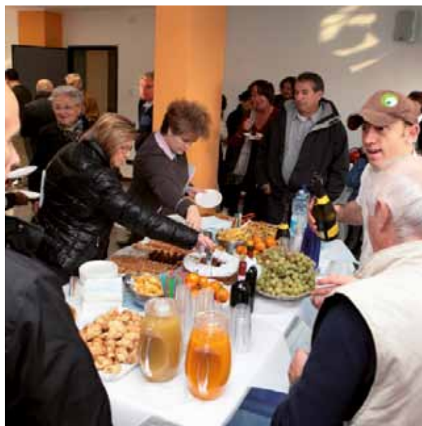
Un momento di convivialità