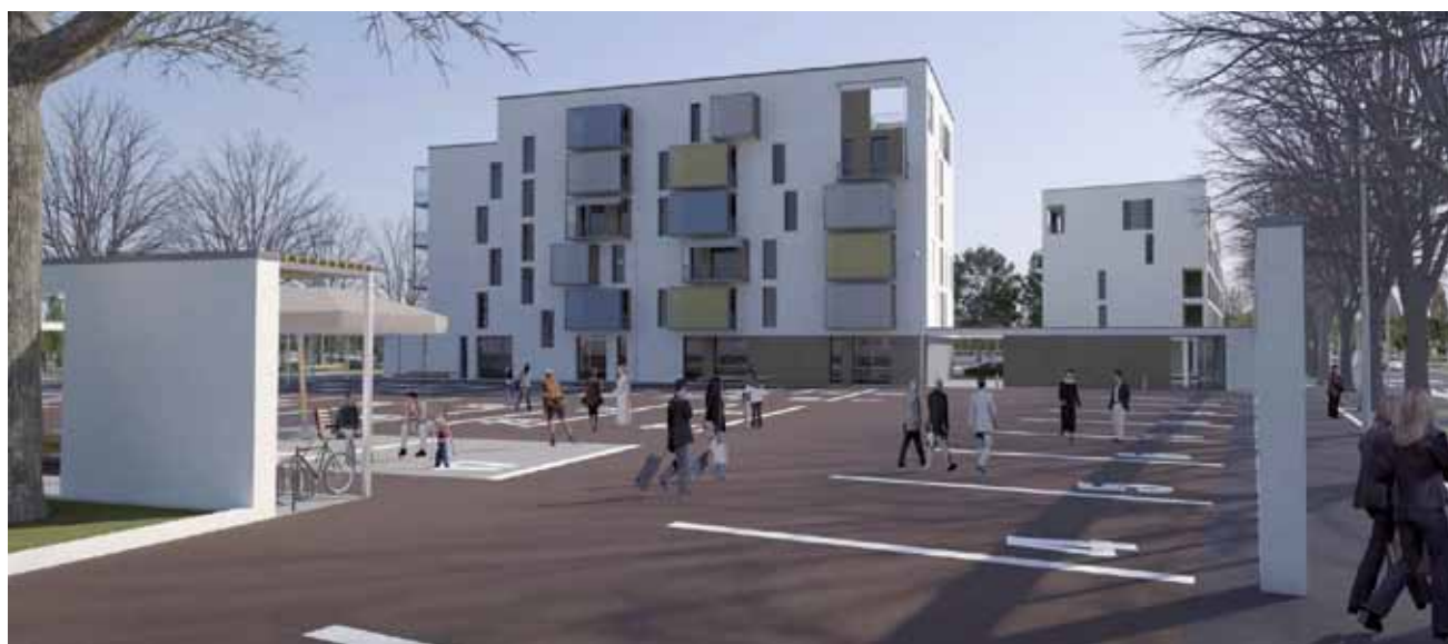
Piazza del mercato ed edificio A