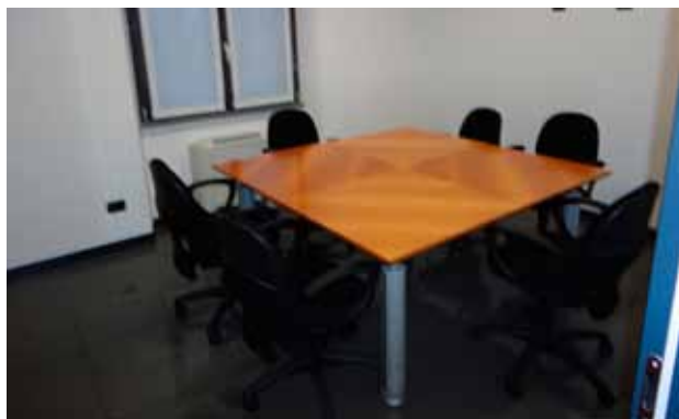
Nuova sala riunioni

Sono terminati i lavori di ampliamento degli uffici di via Caldera: l'ufficio gestione patrimonio è riuscito, in tempi brevi, a creare nuovi spazi dedicati all'accoglienza dei Soci nei quali sarà possibile garantire al meglio la vostra privacy. Un lavoro importante di riqualificazione degli uffici, anche dal punto di vista impiantistico, che ha permesso inoltre, di creare una sala riunioni, di ampliare l'ufficio di presidenza, di creare una piccola sala fotocopie, e di riorganizzare e razionalizzare gli spazi interni dei diversi uffici. Siamo sicuri, così, di poter lavorare nelle condizioni migliori per poter offrire il massimo dell'attenzione alle esigenze dei Soci.