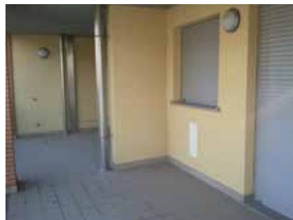
Esempio di loggia per appartamento tipo