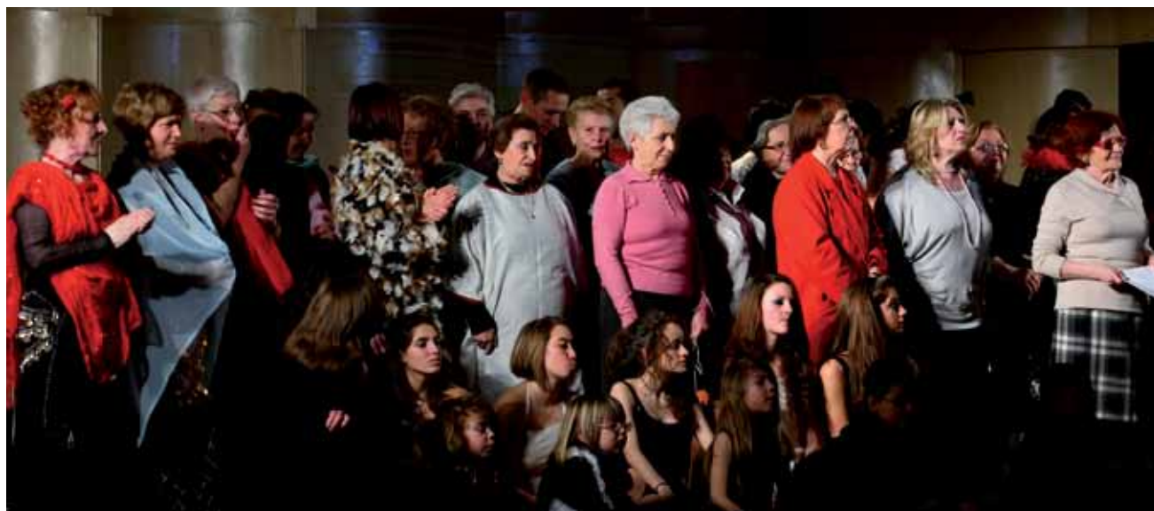
Un momento dello spettacolo di domenica 30 gennaio 2011