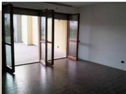
Le rifiniture: ceramiche monocottura prima scelta